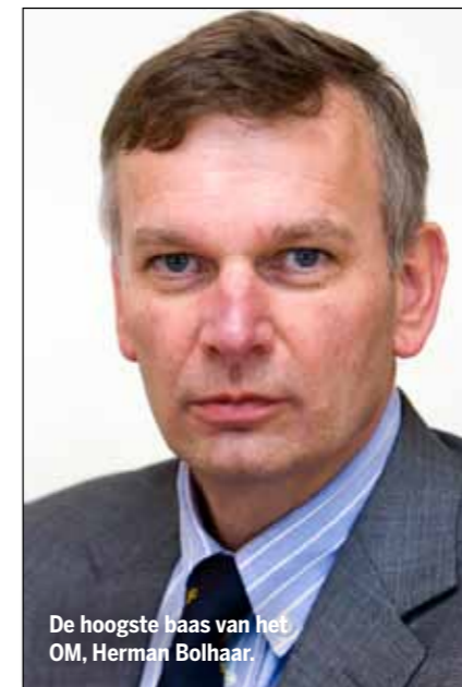
De hoogste baas van het OM, Herman Bolhaar.

voorjaar een internationaal arrestatiebevel uit tegen Spendlove. Weken later concludeert het OM dat er geen sprake is van valsheid in geschrifte en dat Spendlove als forensisch arts kan optreden omdat registratie niet verplicht is. Ook het parket van Maastricht, dat Spendlove heeft gevraagd voor contra-expertise in de zaak van de Geleense baby moorden, concludeert na eigen onderzoek dat Spendlove als deskundige kan optreden. Maar de hoogste baas van het OM, voorzitter van het college van procureurs-generaal Herman Bolhaar, adviseert op 30 mei alle hoofdofficieren van justitie 'geen gebruik te maken van de diensten van Spendlove en hem niet in te schakelen als deskundig (forensisch) patholoog'. Ook worden de officieren geacht zich te verzetten als advocaten Spendlove als deskundige willen