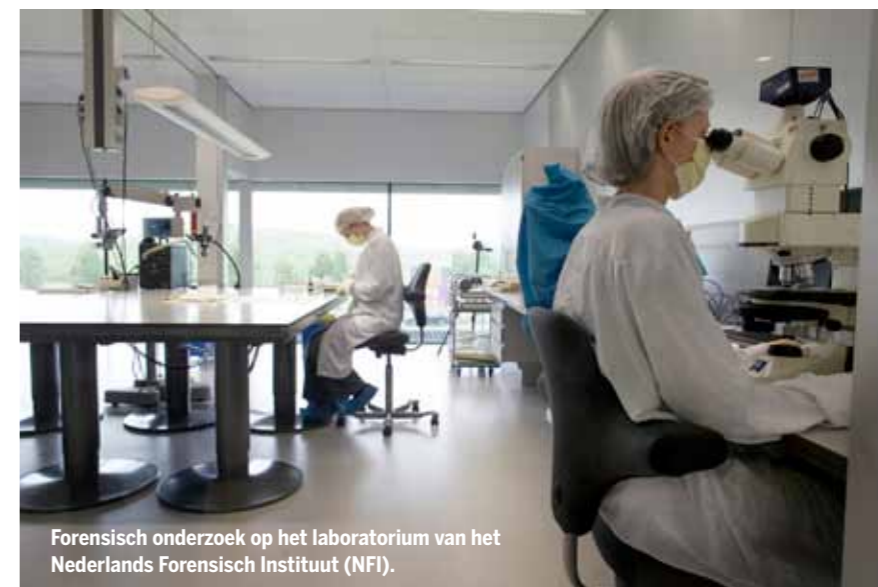
Forensisch onderzoek op het laboratorium van het Nederlands Forensisch Instituut (NFI).